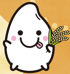
コメフェス オリジナルキャラクター 「こめっぴー」