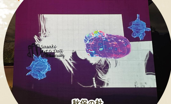
秋保の杜 佐々木美術館&人形館 夜の美術館

美術館の壁に映し出される、躍動する光と幻想的な映像は 息をのむほどの美しさ。アキウルミナ期間中に合わせて館 内での光の展示やインスタレーション、ツリーハウスのライト アップも行っているため、夜の美術館を散策してみたいか がでしょう。