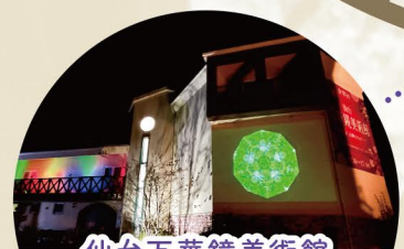
仙台万華鏡美術館

【時間】18:00~21:00 【備考】個人敷地内ですので 沿道よりご覧ください