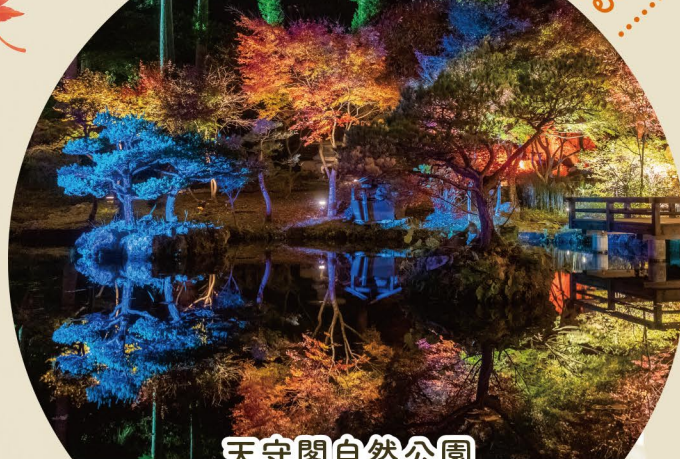
天守閣自然公園 秋保ナイトミュージアム

【期間】10.25(金)▶11.24(日) 【時間】17:00~21:00(Last 20:30) 【会場】天守閣自然公園 小屋館跡庭園 【電話】022-398-2111(10:00~17:30)