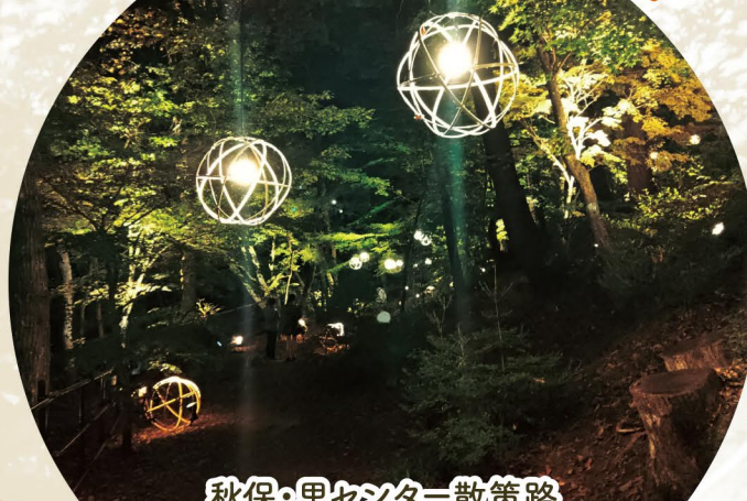
秋保・里センター散策路 磊々峡もみじのこみち ライトアップ

秋保の観光名所・磊々峡 で行われるライトアップ。 散策路内のもみじや、名取川沿い の岩壁を美しく照らし出すライトアップは ここでしか見られない特別な景観です。